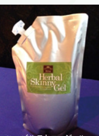
ハーバルスキニージェル

を結んでいるので、他のメーカーから同じハーブを使用して発売することは不可能なものです。私がハーブを仕入れにタイに行った時は国として迎え入れていたため、空港の人間窓口も別ですし、前後に警察車両が移動した(伊藤さん)。